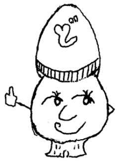
イラスト by Kさん&Oさん